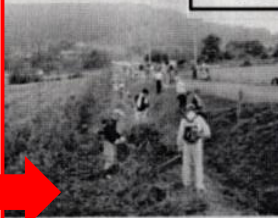
農地法面の草刈り