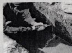
水路のひび割れ補修