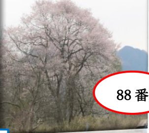
三村久宅東約八十米