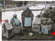
石仏に見られる磯部の邑と施主の名前は？