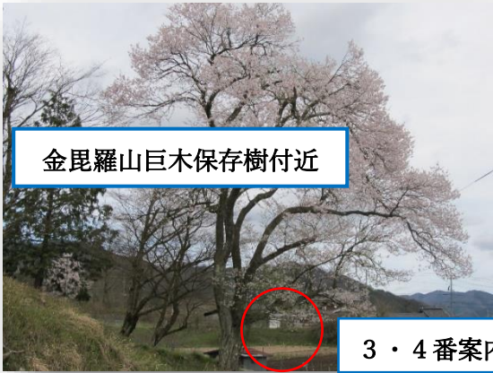
金毘羅山巨木保存樹付近