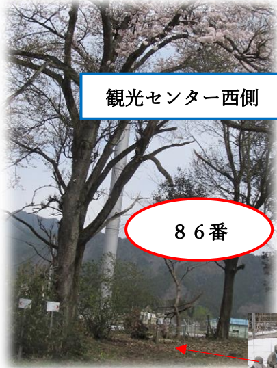
観光センター西側