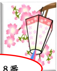
「金浦の歩み」より引用