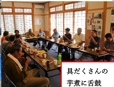
具だくさんの 芋煮に舌鼓