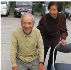
今年 88 歳の 参加者